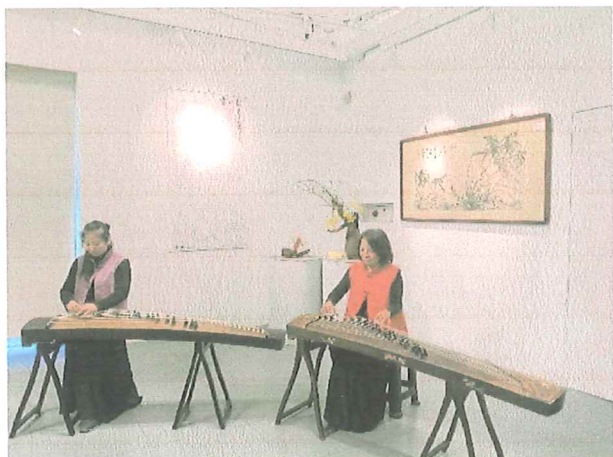
開幕式暖場 古箏演奏