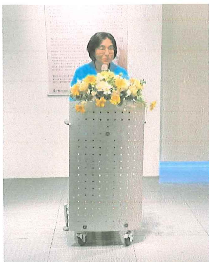
文化局 朱淑敏局長 致詞