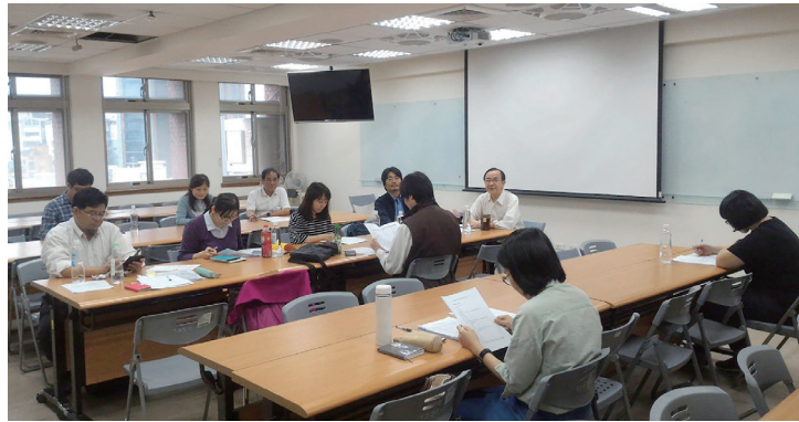
照片 12：「續修新竹縣志（民國 81-104 年）」纂修計畫主持人第五次纂修工作聯席會議照片