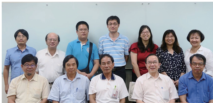
照片 10：「續修新竹縣志（民國 81-104 年）」纂修計畫計畫主持人第一次纂修工作聯席會議照片

民國 105 年 8 月 14 日，召開「續修新竹縣志（民國 81-104 年）」纂修計畫計畫主持人第一次纂修工作聯席會議。會中討論纂修計畫書與卷二～卷九文史調查研究報告的提交內容與日期。另外，則是訂定「《續修新竹縣志》（民國 81-104 年）」撰述體例暨注意事項，供各卷參考。（詳參附錄一「續修新竹縣志（民國 81-104 年）」纂修計畫計畫主持人第一次纂修工作聯席會議紀錄）