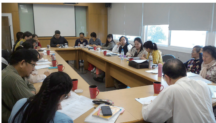
照片 11：「續修新竹縣志（民國 81-104 年）」纂修計畫計畫主持人第三次纂修工作聯席會議照片

民國 106 年 1 月 8 日，召開「續修新竹縣志（民國 81-104 年）」纂修計畫計畫主持人第三次纂修工作聯席會議。會中討論《續修新竹縣志》（民國 81-104 年）纂修案所提交「文史調查研究成果報告」撰寫方式，以及卷二～卷九文史研究調查報告提交總編纂審查日期。（詳參附錄三「續修新竹縣志（民國 81-104 年）」纂修計畫計畫主持人第三次纂修工作聯席會議紀錄）