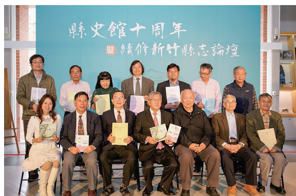
照片 4：邱鏡淳縣長與本志各志計畫主持人合照