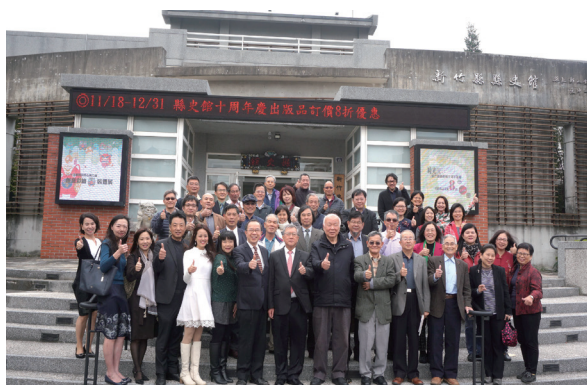
照片 3：續修新竹縣志論壇與會者合照

單位之聯絡窗口，一周內彙送文化局聯絡窗口負責人，以供編纂團隊諮詢。2. 縣志內容涉及各單位之業務範圍，請縣府各局處傾力協助編纂團隊研究調查。3. 請教育處與民政處提供縣內各校退休教職人員及各鄉鎮耆老名單，送交文化局彙整，以備編纂團隊參考。4. 請綜發處將縣府刊物「亮麗竹縣」彙送編纂團隊，以供參考。縣政府為協助本志編纂團隊，獲得更多蒐集編纂資料之資訊，俾本志編纂工作更為順利，於民國 107 年 12 月 13 日舉辦慶祝縣史館 10 周年暨續修新竹縣志論壇。