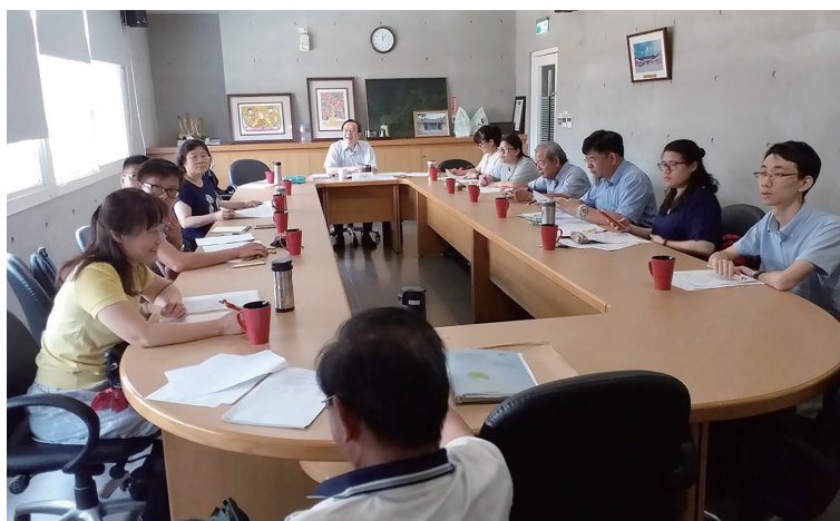
照片 14：「續修新竹縣志（民國 81-104 年）」纂修計畫計畫主持人第七次纂修工作聯席會議照片

民國 107 年 7 月 6 日，召開「續修新竹縣志（民國 81-104 年）」纂修計畫計畫主持人第七次纂修工作聯席會議。會中討論撰寫體例之再確認，以及各卷提供「編纂經過」資料供總編纂撰寫本志之「編纂經過」事項。（詳參附錄八「續修新竹縣志（民國 81-104 年）」纂修計畫計畫主持人第七次纂修工作聯席會議紀錄）