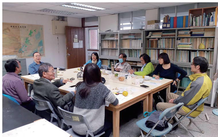
照片 13：「續修新竹縣志（民國 81-104 年）」纂修計畫計畫主持人纂修工作聯席會議第一次臨時會議照片

民國 106 年 11 月 19 日，召開「續修新竹縣志（民國 81-104 年）」纂修計畫計畫主持人纂修工作聯席會議第一次臨時會議。會中討論《續修新竹縣志（民國 81-104 年）》擴充案的圖片、圖像、統計表之計酬方式（稿費支付方式），以及《續修新竹縣志（民國 81-104 年）》擴充案，在合約中需訂定新竹縣政府文化局未依合約中所定期限撥款時的處理辦法。另外，還討論簽辦編列印製經費中，有關總編纂文稿總校訂經費之編列的問題。（詳參附錄七「續修新竹縣志（民國 81-104 年）」纂修工作聯席會議第一次臨時會議紀錄）