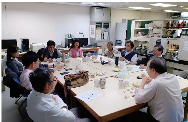
照片 15：「續修新竹縣志（民國 81-104 年）」纂修計畫計畫主持人第八次纂修工作聯席會議照片

民國 108 年 4 月 14 日，召開「續修新竹縣志（民國 81-104 年）」纂修計畫計畫主持人第八次纂修工作聯席會議。會中討論「續修新竹縣志（民國 81-104 年）」撰寫體例不一致現象、及卷篇內容重疊的問題、撰寫體例的些微調整，以及各卷索引的問題。（詳參附錄九「續修新竹縣志（民國 81-104 年）」纂修計畫計畫主持人第八次纂修工作聯席會議紀錄）