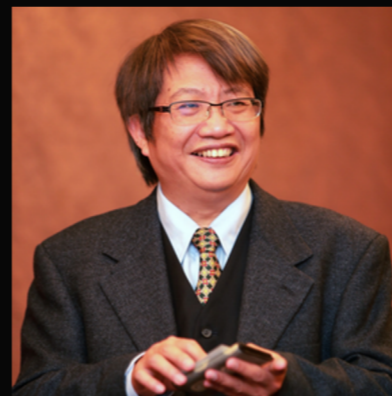
潘 潘 委員